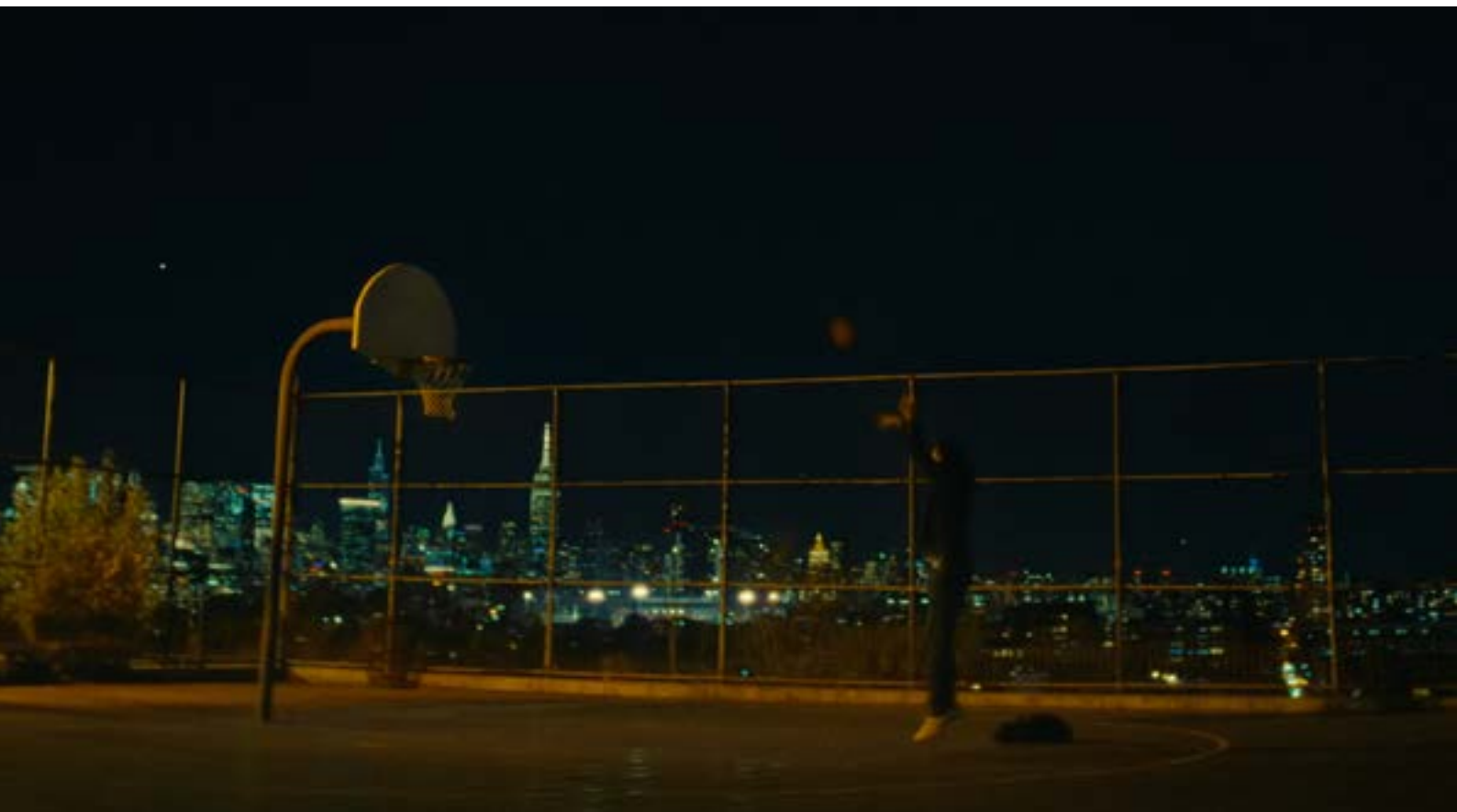
Slika 8. Dražen u New Jerseyu

Neke od najpoznatijih sportskih drama dokumentarni su filmovi, primjerice Senna (2010, r. A. Kapadia), Free Solo (2018, r. J. Chin i E. Chai Vasarhelyi) ili Ikar (Icarus, 2017, r. Br. Fogel) o dopinškom skandalu na zimskim olimpijskim igrama u Sočiju. U Hrvatskoj su, s obzirom na veliki uspjeh hrvatskih sportaša, snimljeni dokumentarni filmovi o Ivici i Janici Kostelić, braći Sinković, nogometnoj reprezentaciji i drugi, od kojih vrijedi spomenuti i dokumentarni film Jakova Sedlara Košarkaški Mozart (1996.) o Draženu Petroviću.