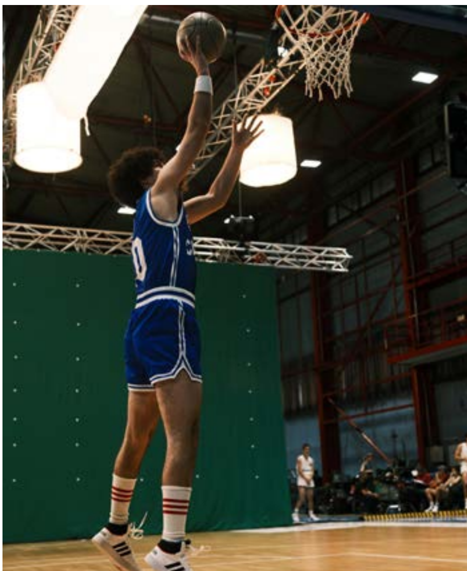
Slika 5. Behind the scenes snimanja utakmice

Kao izražajno sredstvo i stvaralački postupak vezivanja pojedinih kadrova, montaža u filmu Dražen ovisi o pojedinoj sceni; u prizorima s igranjem košarke ona je ritmička, dok u prizorima razgovora među pojedinim likovima ima sporiji tempo izmjena kadrova kako bi se naglasila njihova stanja i odnosi. Redatelji povremeno koristi postupak elipse kao diskontinuiranoga montažnog prijelaza, pri čemu se preskaču pojedina zbivanja radi sažimanja priče ili naglašavanja određenih događaja. U postprodukcijskoj fazi rada na filmu, odnosno u radu na prethodno snimljenom materijalu, korišteni su vizualni efekti poput tehnike zelenog zaslona kada se na tako snimljenom prizoru slika naknadno dodaje.