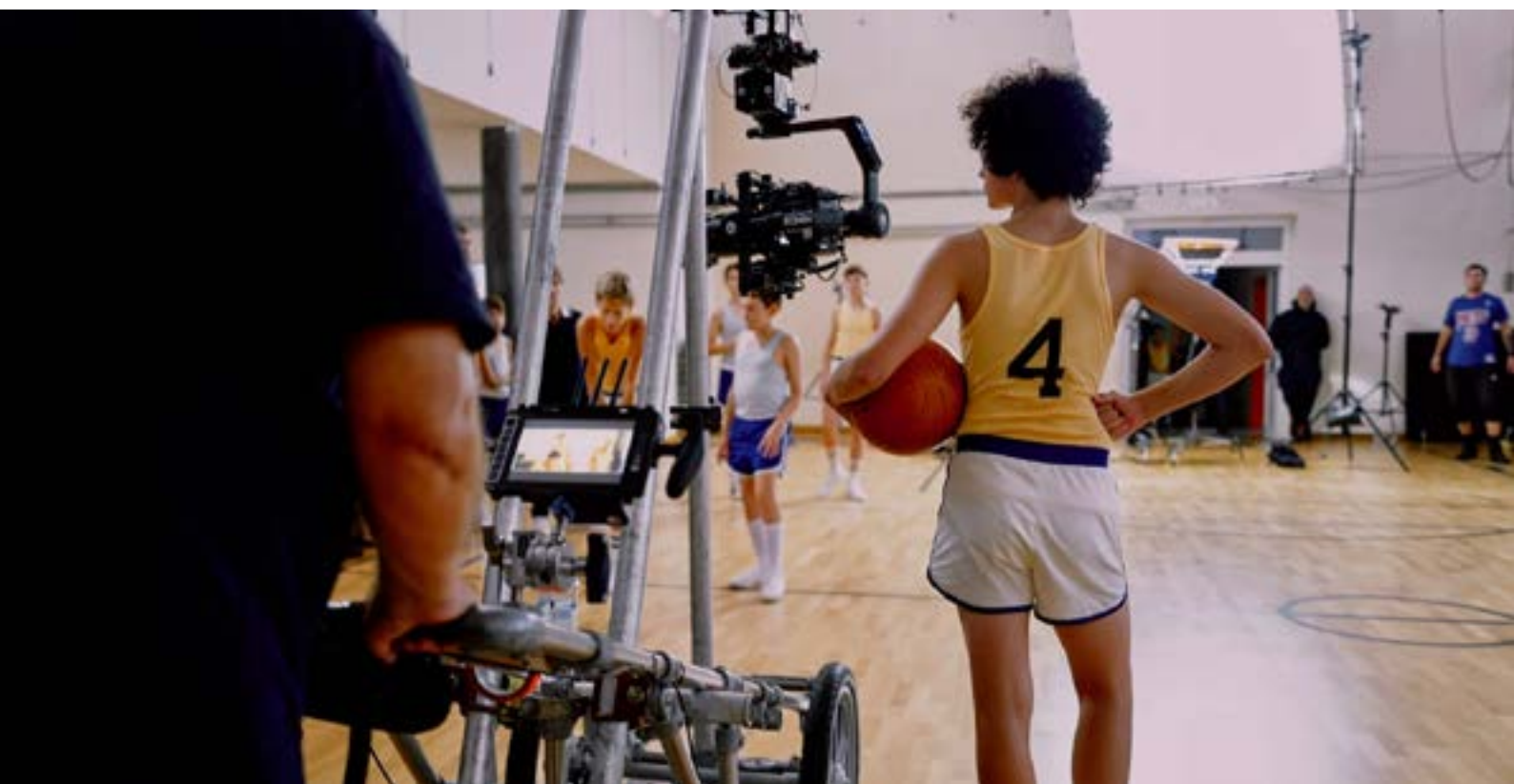
Slika 10. Behind the scenes snimanja utakmice

Možete li objasniti englesku frazu alone at the top ? (Kad si na vrhu, najbolji si, ali ondje si isto tako usamljen – svi drugi su ispod tebe, i rivali i prijatelji.)