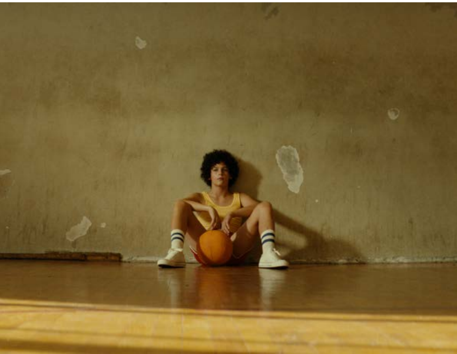
Slika 3. Dražen nakon treninga

Dražena Petrovića u njegovoj su nadahnjujućoj sportskoj karijeri redovito nazivali 'košarkaškim Mozartom' čime su ga usporedili s jednim od najvećih austrijskih i svjetskih glazbenika svih vremena Wolfgangom Amadeusom Mozartom (1756.– 1791.). Obojica su zarana pokazali nevjerojatnu darovitost u onom čime su se bavili u životu pri čemu je košarka u cijelosti odredila Draženov put. Pritom su njegova igra na terenu i ubacivanje koševa počesto djelovali poput glazbe. Njegov lik u filmu za košarku tvrdi da je 'nešto jače od mene', a lik njegove majke Biserke da je 'njegov život košarka', dok su 'svi drugi tu da mu u tome pomognu'. Stoga je u središtu filma spoj ljubavi prema sportu i – predanog rada i upornosti da bi se u bavljenju sportom postigli vrhunski rezultati. Ti su Draženovi rezultati bili plodom njegova talenta, posvećenosti košarci i podrške koju je dobivao od svoje obitelji do milijuna obožavatelja koji su ga pratili u domovini i svijetu. Također, film tematizira što sve bavljenje profesionalnim sportom donosi, uključujući iscrpljujuće treninge te razočaranja s kojima se i najbolji sportaši neizbježno suočavaju. Iako je riječ o priči u kojoj je unaprijed poznat tragičan završetak života središnjeg lika, film slavi svoga naslovnog junaka kroz jedinstvenu sportsku karijeru te utjecaj na druge ljude.