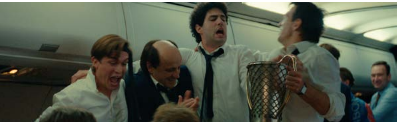
Slika 2. KK Cibona nakon osvajanja Kupa europskih prvaka