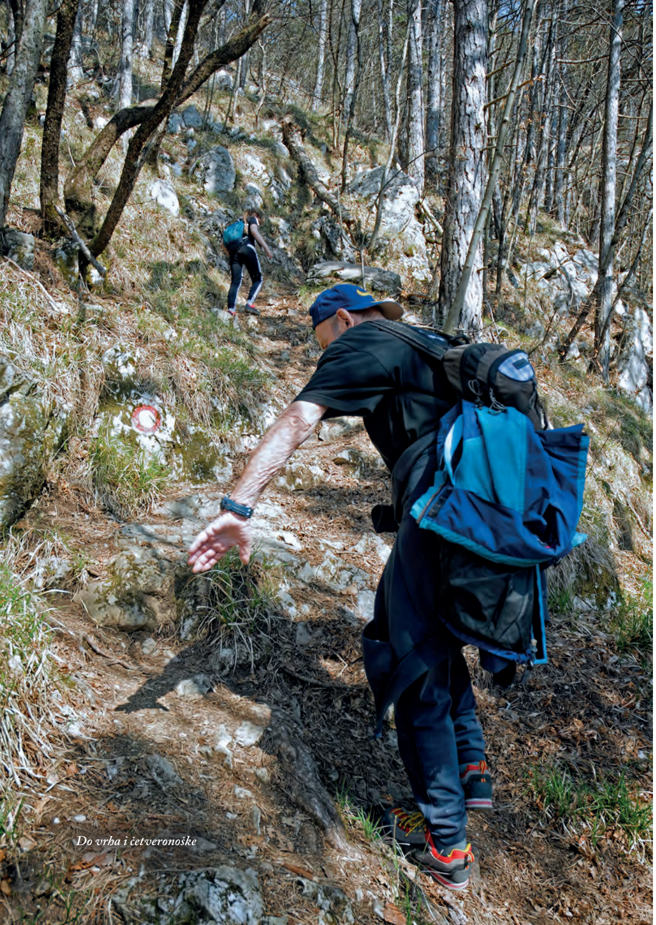
Do vrha i četveronoške