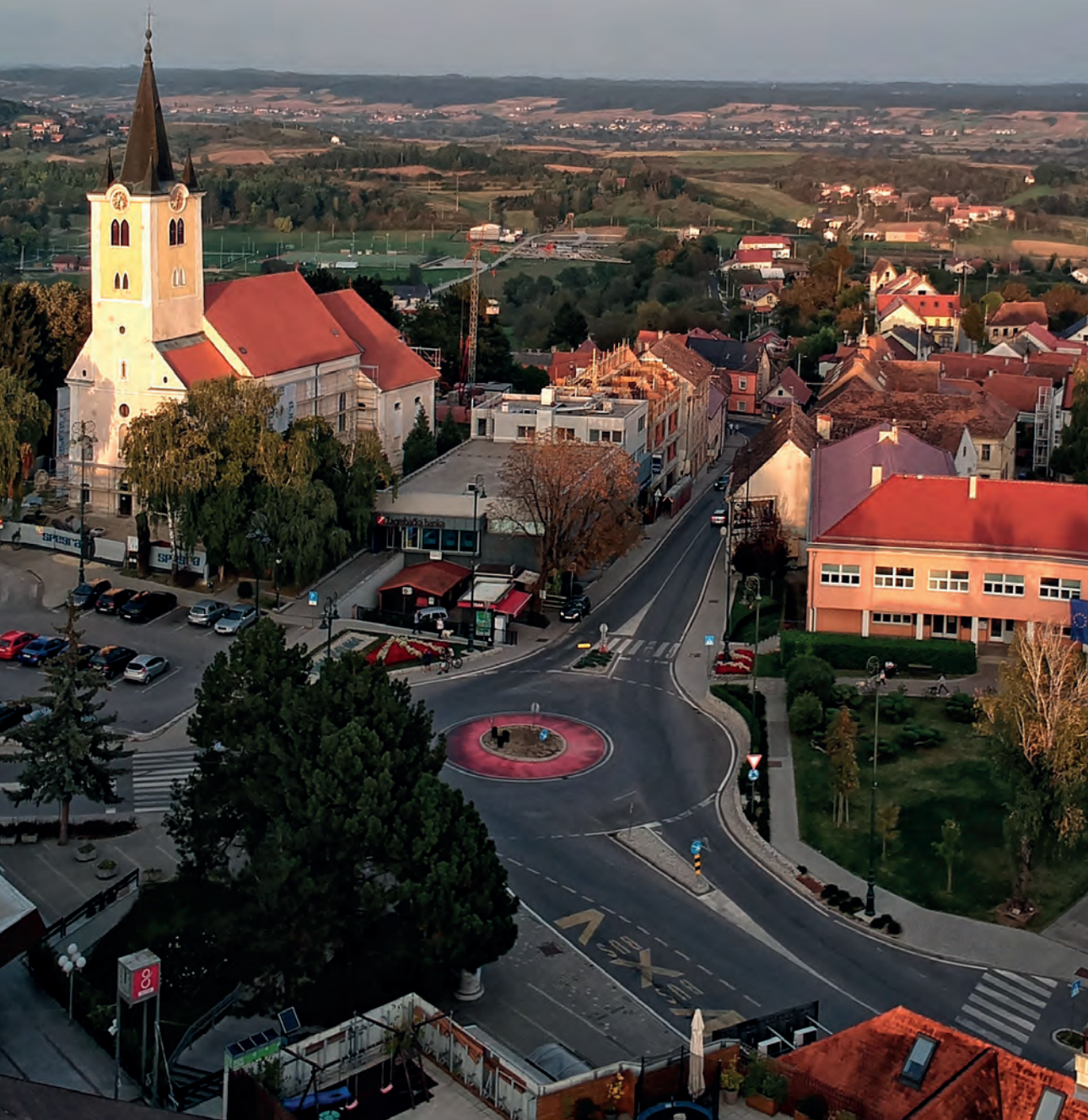
Zelinski plac, sjeverna strana