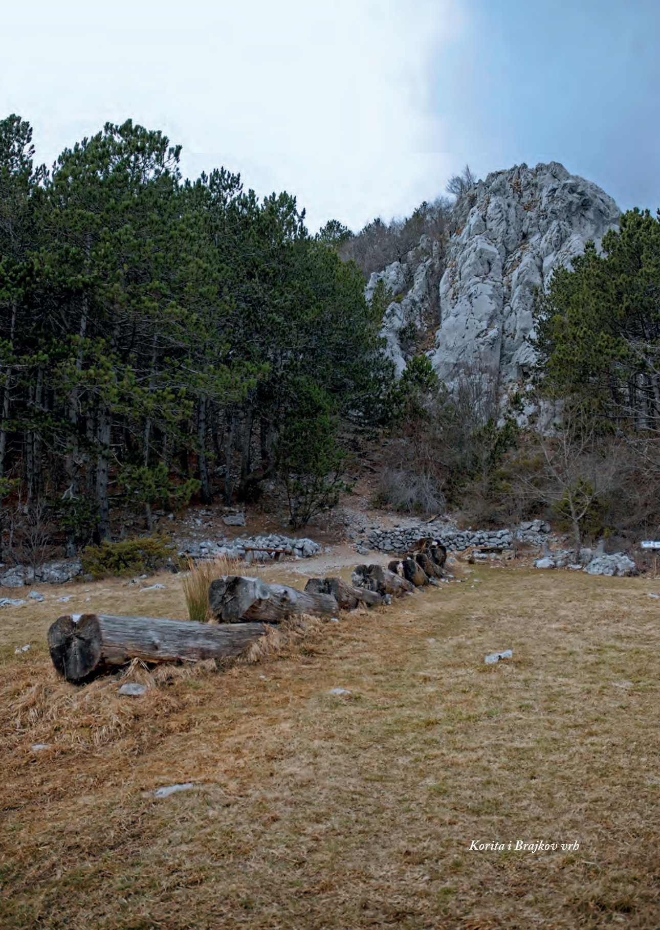
Korita i Brajkov vrh