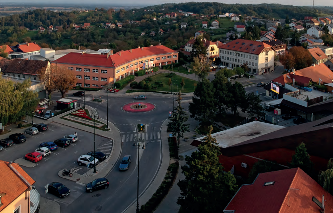
Južna strana zelinskog placa