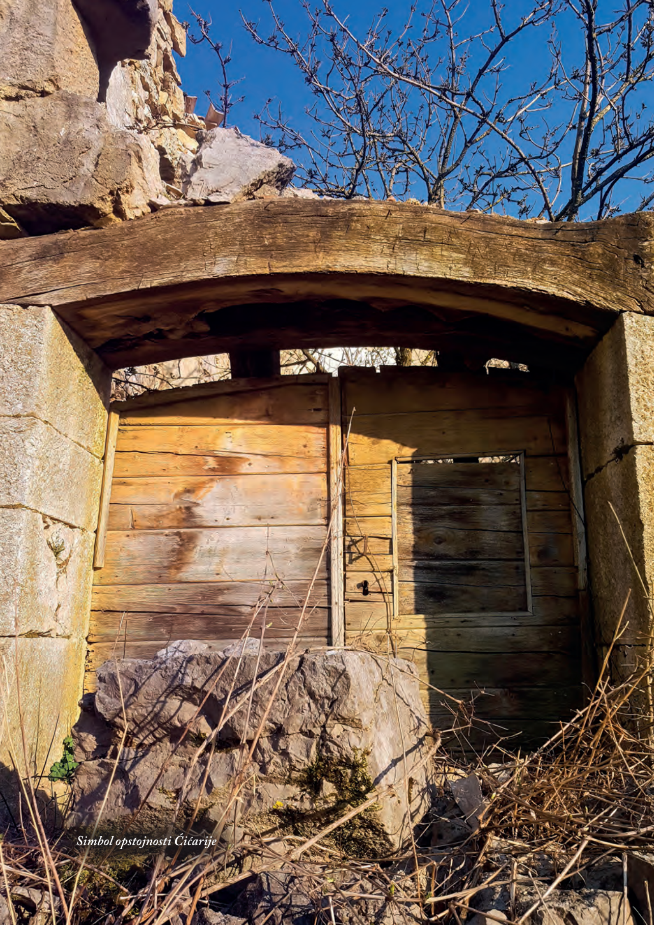
Simbol opstojnosti Čičarije