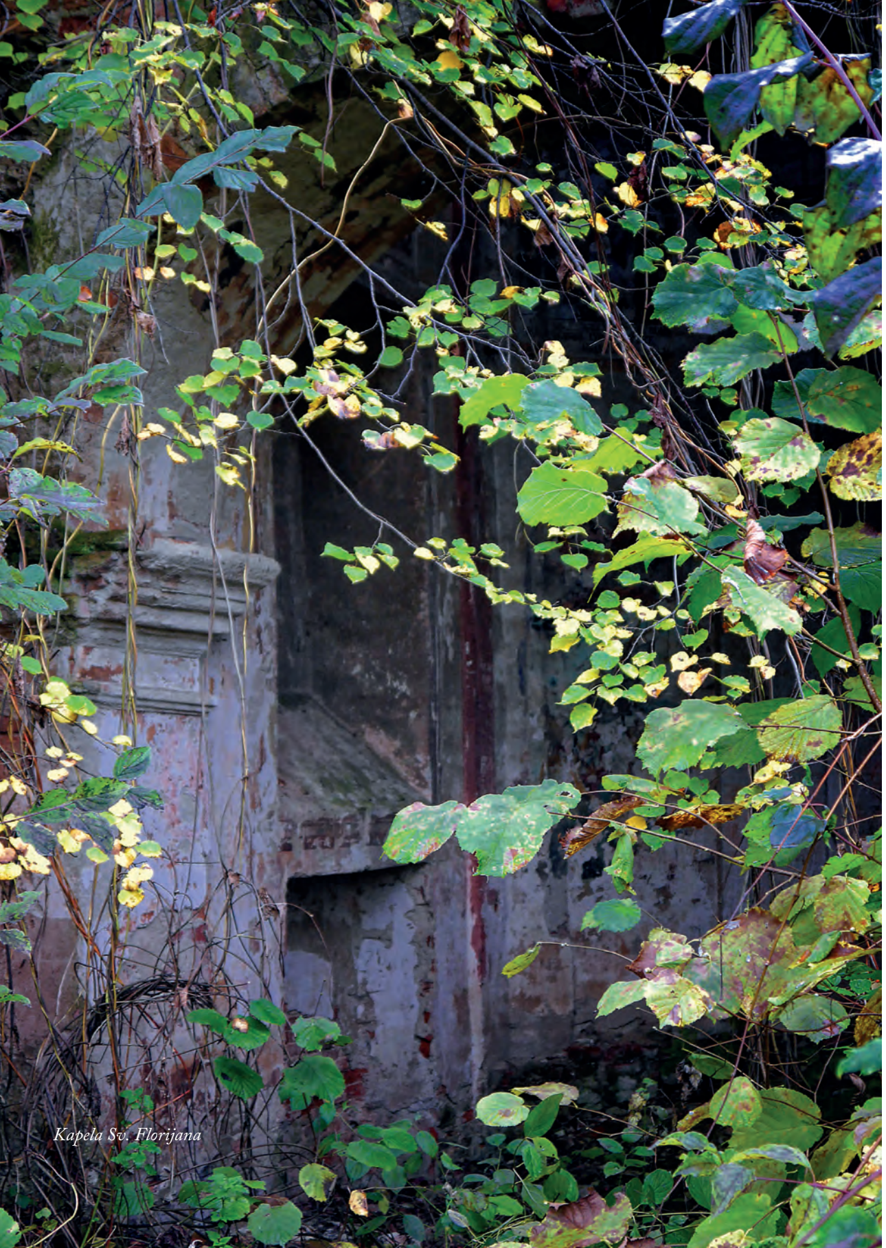
Kapela Sv. Florijana