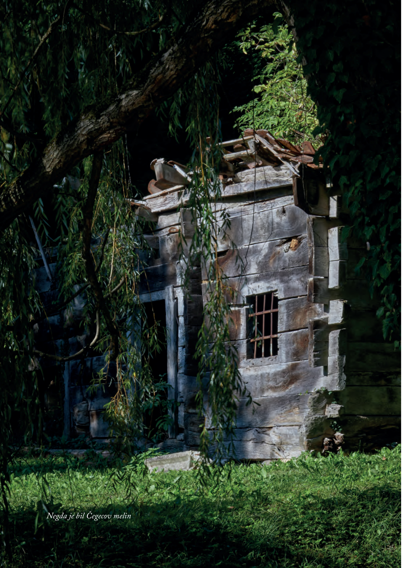
Negda je bil Čegecov melin