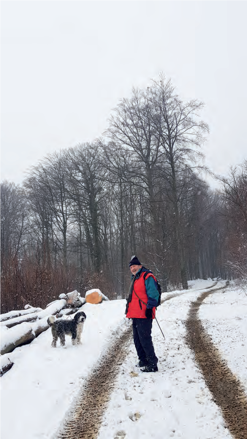
Po Zelinskoj gori