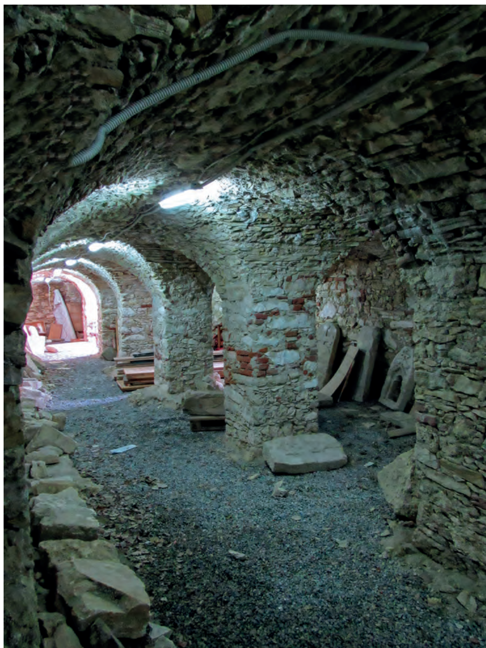
Barokna grobnica pod južnim cintonom

s najviše arheoloških podataka i materijalnih ostataka, o posebnom novodoseljenom panonsko – slavenskom i hrvatskom stanovništvu u ranom srednjovjekovnom dobu, koje je i dalo najviše nalaza. Nakon što je predromanička bazilika porušena na prijelazu iz 12. u 13. stoljeće izgrađena je kasnoromanička jednobrodna crkva s