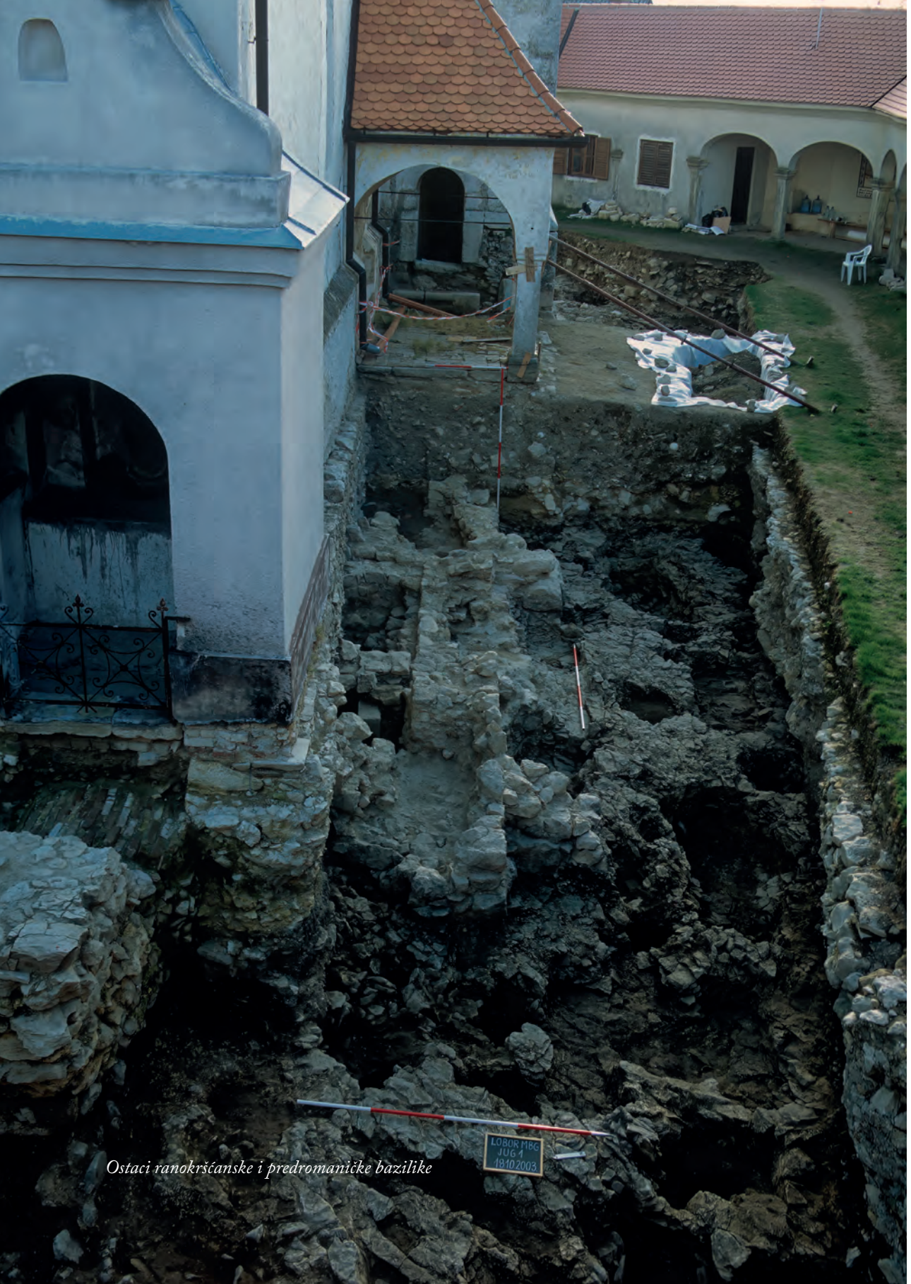
Ostaci ranokršćanske i predromaničke bazilike