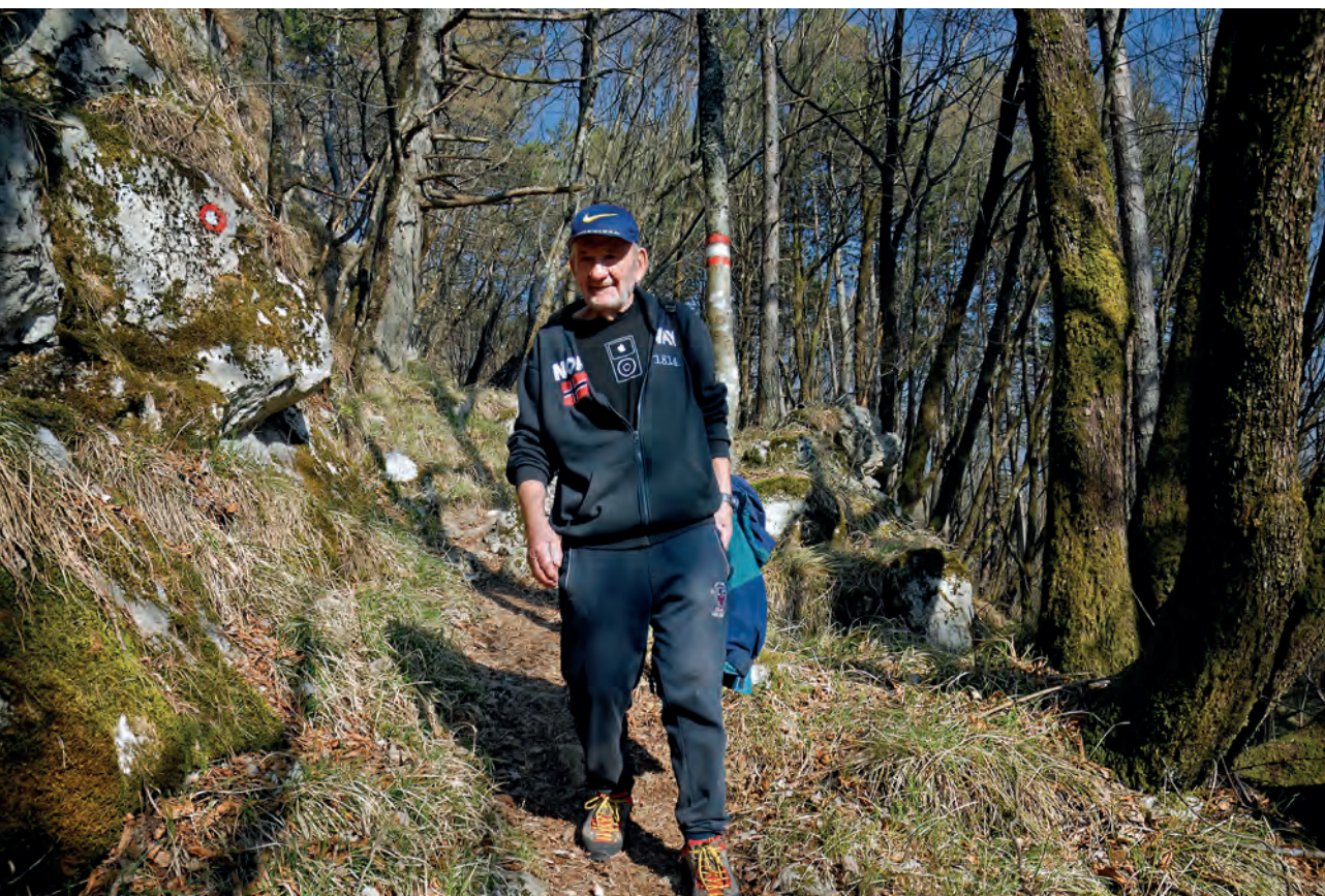
Povratak u Brest

Za povratak u Brest izabrali smo drugu označenu stazu, dužu, vrludaviju i stoga nešto manje zahtjevniju. U početku se spušta niz ogoljelu kamenitu strminu velikodušno nudeći zadnji pogled na Čičariju i Učku, a onda zađe u šumu bjelogorice i krene serpentinama rubom oštre strmine. Kao da se spuštam beskrajno dugom skalinadom na kojoj mi za rukohvat na najstrmijim mjestima posluži kakva grana kržljavog drveta ili ništa manje kržljavog grma. Dok se tako spuštamo, dovikujem se s Valentinom i Doricom koje su čas preda mnom, čas iza mene (diskretno me pazeći), a djeca i Grga daleko ispred nas, zapitam se koliko je slučaj kriv („ Tko ne vjeruje u slučaj, neka baci na autora “ - FHK u predgovoru putopisa) za to što je Kiš susreo onu učiteljicu i upoznao župnika i uspeo se pored svih čičarijskih vrhova baš na Žbevcu. Ili možda nije slučajno sišao s vlaka u Rakitoviću jer se još u Zagrebu odlučio popeti na Žbevcu? A onda ga zamislim u građanskom odijelu, sa šeširom i kravatom, s kišobranom u jednoj i kartonskim koferićem u drugoj ruci i to mi izmami osmijeh jer ja landram njegovim putima opremljen kako je danas uobičajeno za planinarenje. Kakav li je samo morao ostaviti dojam pred Čićima tako gospodski zrihtan i uglađen?